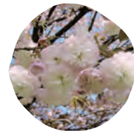
2 普賢象 (フゲンゾウ) 開花時期: 4月下旬

花の色は淡い紅色で、中心部は濃い赤が残ります。花びらの枚数は100枚から300枚ほど。その名の通り、金沢の兼六園にある桜です。国の天然記念物として指定された原木の「兼六園菊桜」は、樹齢を経るごとに花びらの枚数が増え、晩年には300枚もの花びらをつける程になったと言われています。