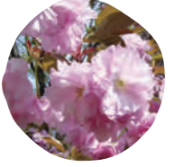
3 関山 (カンザン) 開花時期: 4月下旬

花の色は淡紅色。花びらの枚数は30枚から50枚。室町時代から知られている、最も古い里桜の代表的な品種。大形の花が咲き、樹木が強靱で大木に成長します。葉化した二本の雌しべの姿が、普賢菩薩の乗る「六牙の白象」の鼻に似ていることから、この名が付けられたと言われています。