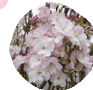
10 天の川 (アマノガフ) 開花時期: 4月中旬～4月下旬

※河津桜は、仮設店舗の撤去作業のため、残念ながら2008年の開花時期前に植樹することができません。ご了承ください。