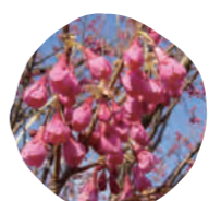
8 寒緋桜 (カンヒザクラ) 開花時期: 3月上旬～3月中旬

花の色は白色。花びらの枚数は5枚。花と葉が同時に開く、山に咲く野生の桜を総称して「山桜」と呼びます。ヤマザクラは古来より日本人に親しまれ、小倉百人一首などの和歌にも詠われています。また、桜の名所である奈良・吉野山の桜もほとんどが「ヤマザクラ」です。