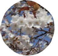
6 山桜 (ヤマザクラ) 開花時期: 4月上旬～4月中旬

花の色は薄い紅白色から濃い紅色。花びらの枚数は5枚。エドヒガンの変種で、その名の通り枝が垂れ下がることから枝垂桜と呼ばれています。別名「糸桜」。赤坂サカスの枝垂桜は、「日本三大桜」のひとつで天然記念物にも指定されている、福島県三春町の「滝桜」の子孫樹です。薄いピンク色をした小さい花が滝の飛沫が流れ落ちるように咲く姿は、まさに圧巻の一言です。