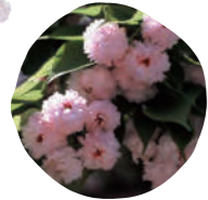
1 兼六園菊桜 (ケンロクエンキクザクラ) 開花時期: 4月下旬～5月上旬

「赤坂サカス」には11種類の桜が植えられています。今年のお花見は「赤坂サカス」でお待ちしています！