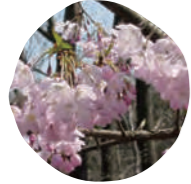
4 思川 (オモイガフ) 開花時期: 4月上旬～4月中旬

花の色は濃い紅色。花びらの数は25枚から50枚。人が里で交配・開発した品種を総称して「里桜」と言います。その代表格が「関山」です。里桜の別称である「八重桜」の代表格としても有名。古くからお見合いや婚礼の場など、おめでたい席で給仕される「桜湯」に入れる桜の花の塩づけによく使われています。