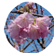
9 河津桜 (カワヅザクラ) 開花時期: 3月上旬～3月中旬

花の色は淡い白紅色。花びらの枚数は10～15枚。大ぶりの花をつけるこの品種は、もともとはイギリスで交配された桜です。イギリスでは春にしか咲かないのですが、気候や風土の違いからか、日本では4月と10月の二度咲く「二季咲きの桜」として知られています。