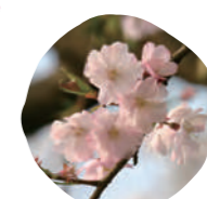
7 アーコレード 開花時期: 4月上旬/10月上旬

花の色は濃いピンク色。花びらの枚数は5枚。縦長の小さい房のような花が釣鐘状に咲きます。本来は台湾を中心とした南方の暖かい地方に生息他の桜に先駆けて咲くため、よく「春を告げる桜」としてニュースをにぎわす桜です。