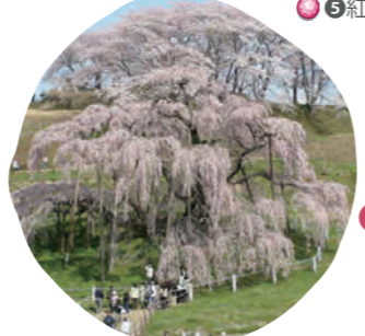
5 紅枝垂 (ベニシダレ) 開花時期: 3月下旬～4月上旬

花の色は薄い紅白色から濃い紅色。花びらの枚数は5枚。エドヒガンの変種で、その名の通り枝が垂れ下がることから枝垂桜と呼ばれています。別名「糸桜」。赤坂サカスの枝垂桜は、「日本三大桜」のひとつで天然記念物にも指定されている、福島県三春町の「滝桜」の子孫樹です。薄いピンク色をした小さい花が滝の飛沫が流れ落ちるように咲く姿は、まさに圧巻の一言です。