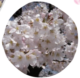
11 染井吉野 (ソメイヨシノ) 開花時期: 4月上旬

花の色は淡い紅色で、花びらの枚数は10枚から20枚ほど。花が上向きに咲くのが特徴で、枝も大きく拡がらないので狭い場所での育成にも適した品種です。淡い芳香も楽しめます。